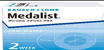
メダリストプラス