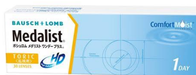
メダリスト 1day プラス乱視用