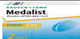
メダリスト 66 トーリック