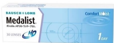
メダリスト 1day プラス